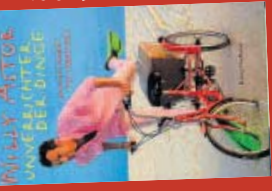
„Unverrichter der Dinge“ erschien im Vonnemann Verlag, 14,90 Euro